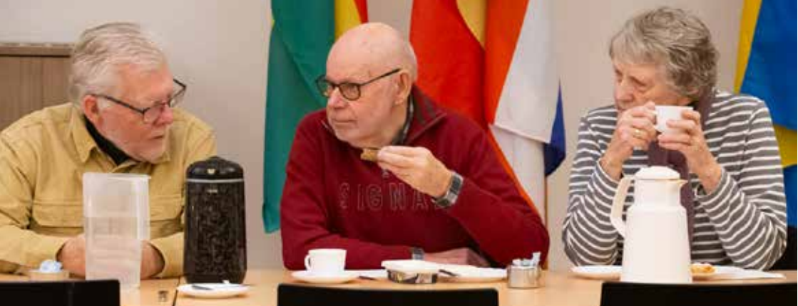
GLIMT FRA EFD'S LEDERFORUM