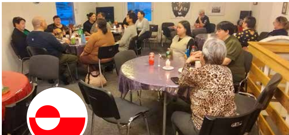
Fællesspisning i Ilulissat

Der er en god ungdomsflok i Ilulissat, som skaber tror på fremtiden. De gik 3 timer ud til Store Aginaq ad slædesporet, i – 18