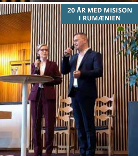
20 ÅR MED MISISON I RUMÆNIEN